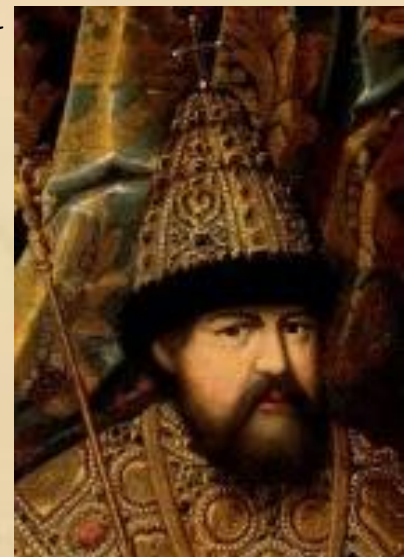
Московський цар Олексій Михайлович