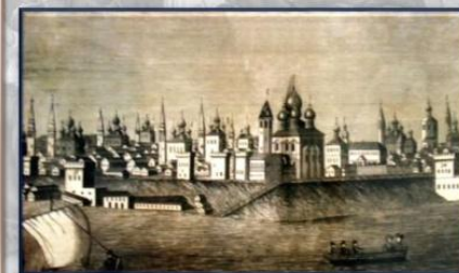
Москва XVII ст.

Відповідь Земського собору на лист Б. Хмельницького