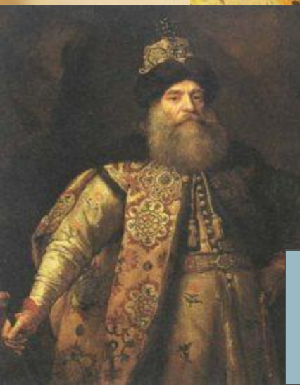
Боярин Василь Бутурлін

Відповідь Земського собору на лист Б. Хмельницького