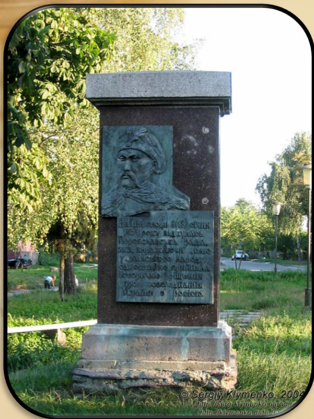
Переяслав-Хмельницький. Площа, на якій 1654 відбулася Переяславська рада.